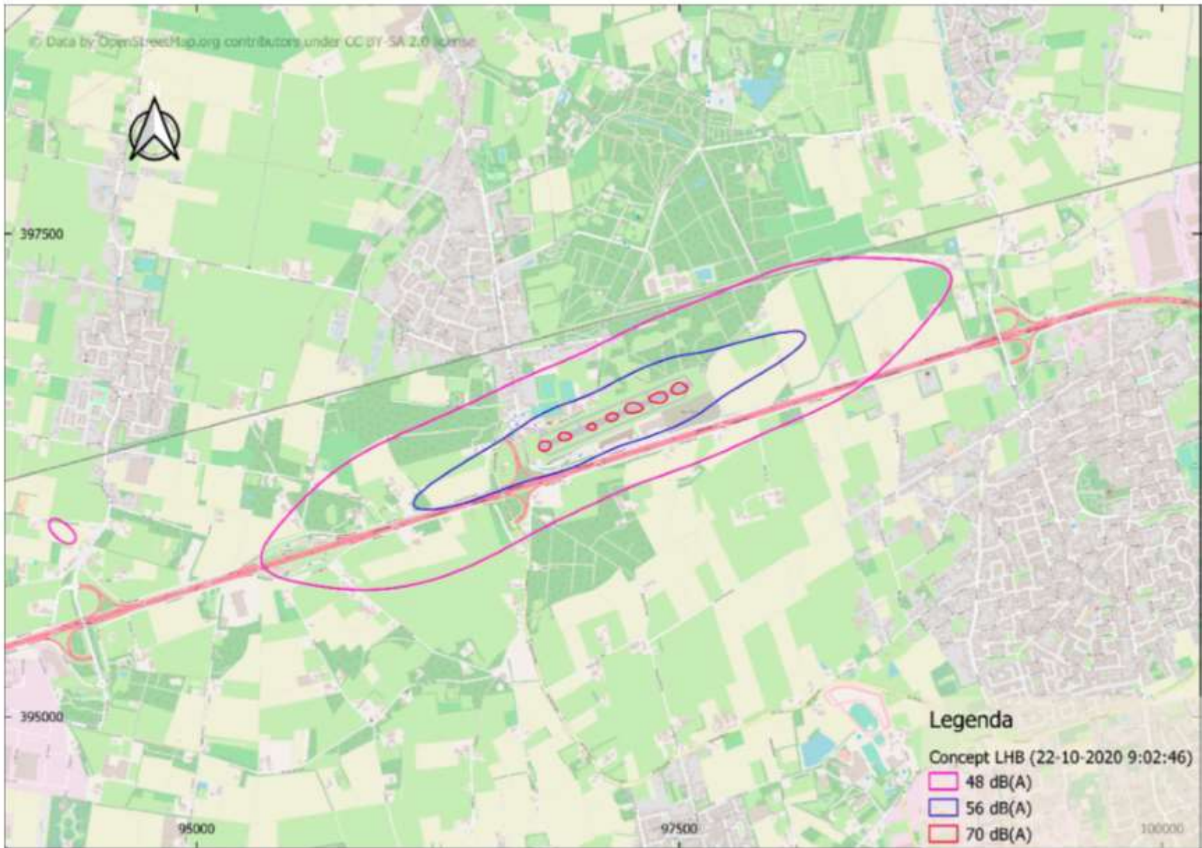
Bijlage 7 behorende bij artikel 11 van de Verordening luchthavenbesluit luchthaven Breda International Airport Noord-Brabant