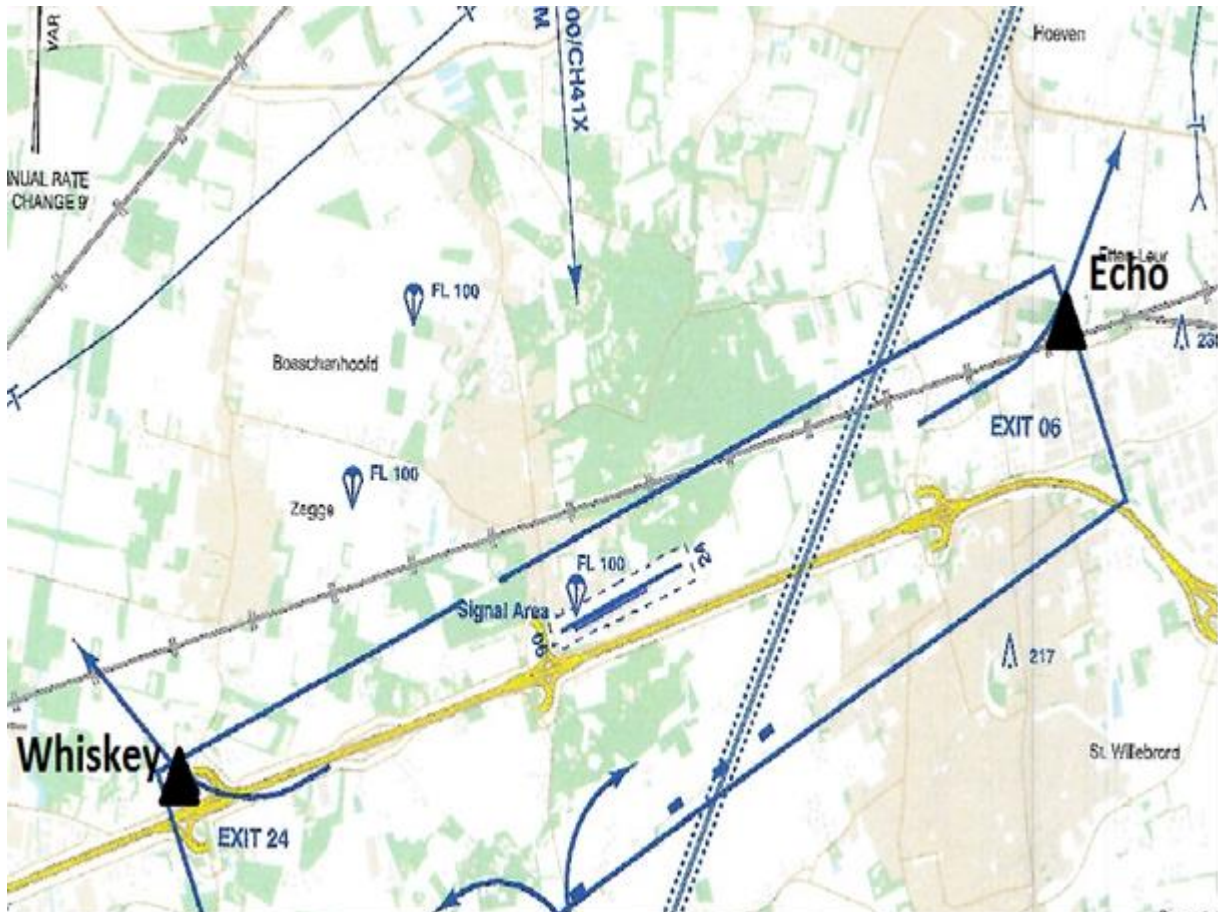
Figuur 1: Knipsel van Bijlage A met Whiskey en Echo aangegeven.

Het doel van dit voorstel is het vestigen van verplichte meldingspunten bij het verlaten van het lokale verkeersgebied. Specifiek wordt voorgesteld om "Whiskey" aan de westzijde (baan 24) en "Echo" aan de oostzijde (baan 06) in te stellen. Zie schets: